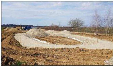
La future aire de jeux sort de terre.

PLUS WEB Plus de photos sur www.lalsace.fr et www.dna.fr