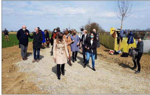
Élus et partenaires du Parc des Carrières ont tenu à être sur place pour se rendre compte de la concrétisation du projet.

Ce sera demain un parc paysager, sur onze hectares, pour rapprocher les habitants des Trois Pays. Le projet a été lancé