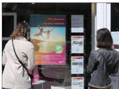
Devant une agence mulhousienne, ce vendredi : « Il faut sécuriser les gens et cela prendra du temps. »

La Sicile, la Sardaigne, la Crète, « qui n'a jamais été fermée et qui a retrouvé les touristes allemands depuis mars », Rhodes, les Canaries... sont également très demandés. Mais ces réservations ne doivent pas cacher un effondrement général du marché. « L'enlèvement de partir existe, mais l'incertitude empêche les gens de venir en agence. Notre activité en 2020 a baissé de 85 % par