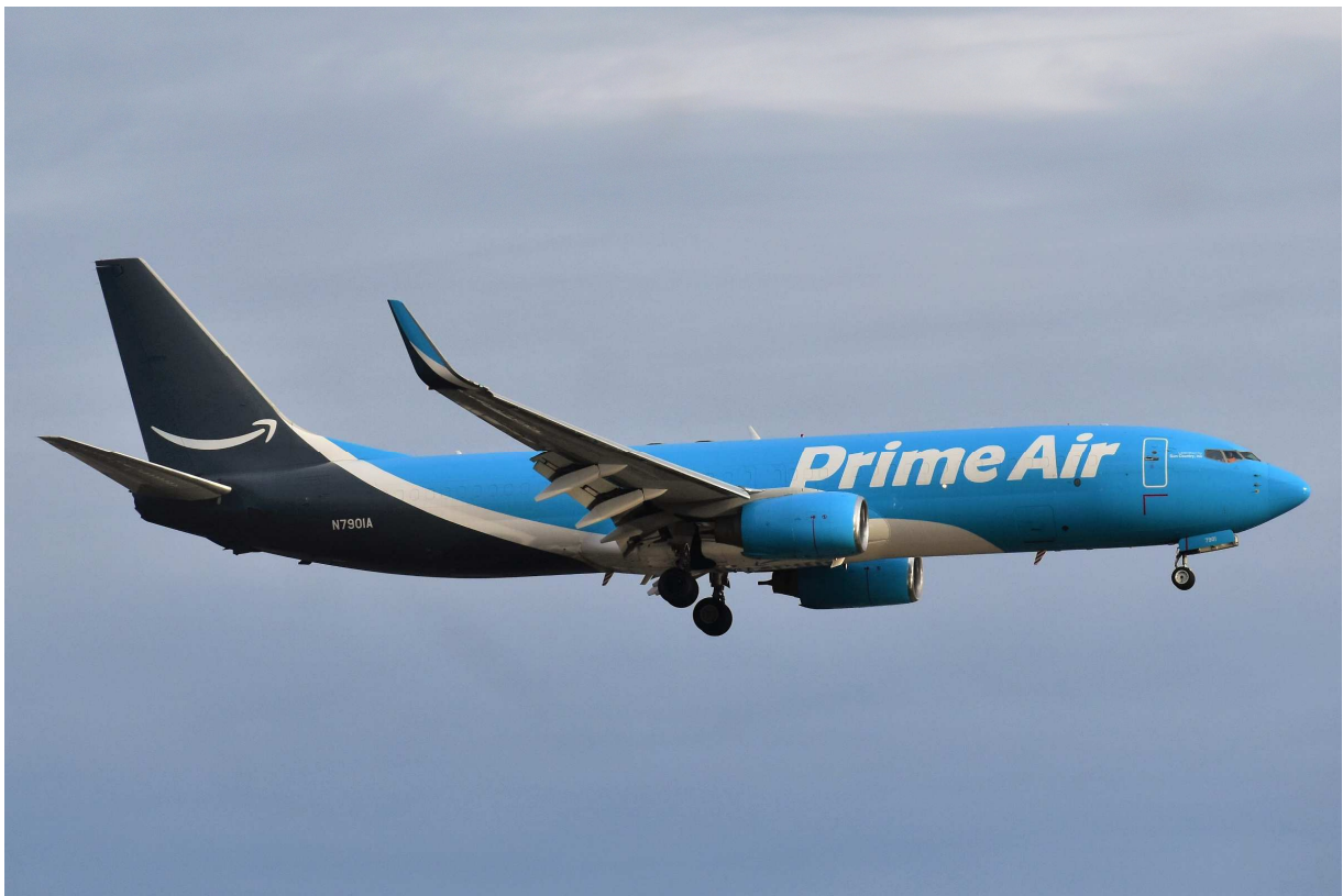
Amazon Prime Air: Boeing 737-84P N7901A