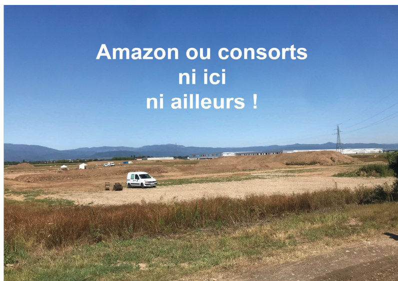
Vue du terrain où doit s'implanter l'entrepôt Eurovia-16 aux portes d'Ensisheim (68). Au fond on aperçoit l'entrepôt Eurovia-15

L'abandon du projet de Dambach et d'Ensisheim en Alsace ne sont que péripétie à l'échelle du monde. Le jour même ou Frédéric Duval, le Pdg d'Amazon France annonce son retrait de l'Alsace, Amazon ouvre un Hub à Leipzig. (5 novembre 2020).