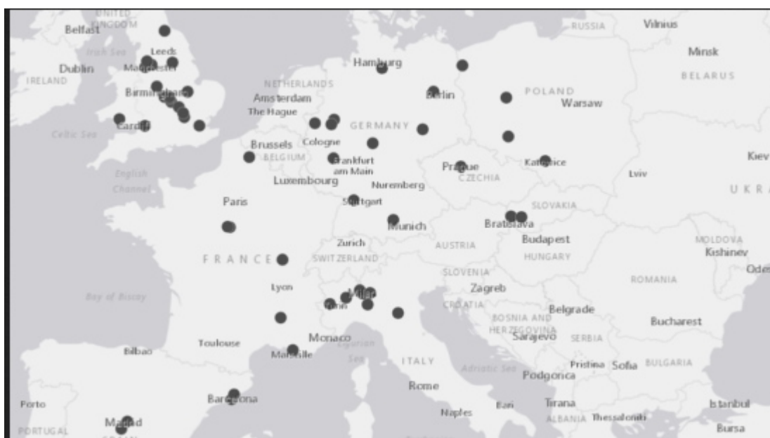
(Carte source Cargo Facts: centres de distribution Amazon en Europe, 2017)

Amazon a créé environ 80.000 emplois en Europe, où l'Allemagne et le Royaume-Uni en représentent presque la moitié 4 . Ses implantations ne sont pas exactement collées à des aéroports, mais évoluent volontiers à leur proximité. L'exception française est celle de Sevrey (Chalon-sur-Saône), où la firme a saisi l'opportunité de la reprise des bâtiments de Kodak à l'époque où Arnaud de Montebourg était ministre du Redressement productif et élu local de Saône-et-Loire (ce qui permet de dire au passage que l'action politique est un paramètre qui peut compter). L'aéroport de Dole-Tavaux est relativement proche de Sevrey (60km), mais son usage général est insignifiant (pas de vols fret, pas de liaisons passagers permanentes).