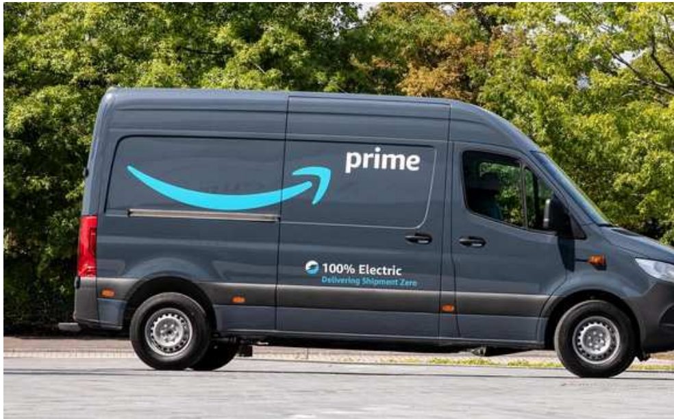
Amazon-Mercedes-Benz-Electric-Van, credit Amazon

Amazon a commandé 1800 camionnettes électriques à Mercedes-Benz en 2020 pour la livraison des derniers kilomètres en Europe. Celles aperçues livrer à Weil-am-Rhein en février 2022 étaient des diesels.